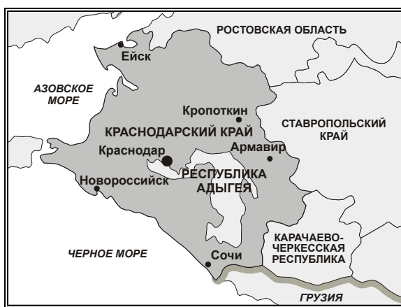
Рис. Карта Краснодарского края

Краснодарский край расположен в Южном федеральном округе, столица – г.Краснодар, находящаяся от Москвы в 1539 км. Площадь территории региона составляет 75,5 тыс.кв.км. Плотность населения на 1 января 2006 г. составляла 67,5 человека на 1 кв.км. Климат умеренного пояса (атлантико-континентальный). На юге - климат горной области Северного Кавказа. Средняя температура января 2005 г.: +3,9°C, июля 2005 г.: +24°C.